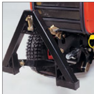
Praktisches Kuppeldreieck für die schnelle Aufnahme von Frontarbeitsgeräten. Starke, getriebeunabhängige Frontzapfwelle mit Normprofil.