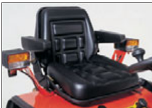
Gedämpfter, auf das Fahrergewicht einstellbarer Komfortsitz mit bequemen Armlehnen.