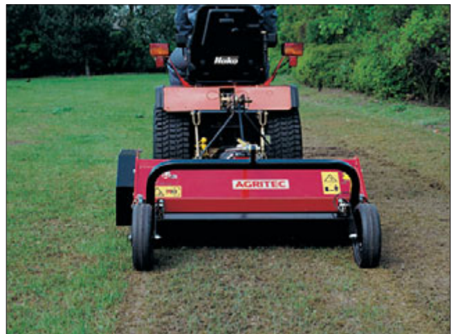
Starke Rasenpflege: Hakotrac 1700 D Hydrostatic mit Heck-Vertikutierer 100 cm. Weitere Anbaugeräte: robuster Schlagmäher, Bodenfräse, Wildkrautbesen, Tennisplatzpflegekombination und Einachsanhänger.