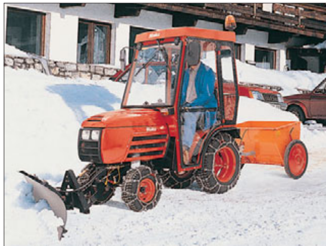
Im Winterdienst bewährt sich der kräftige Allradantrieb. Mit seinem 135 cm breiten, hydraulisch schwenkbaren Schneeschild bereift der Hakotrac 1700 DA schnell und gründlich Parkplätze, Wege und Anlagen von der weißen Pracht. Für das Ausbringen von Sand, Salz, oder Splitt stehen verschiedene Streuertypen zur Verfügung.