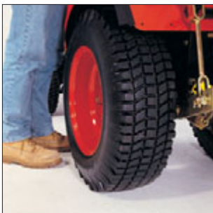
Großdimensionierte Bereifung für die richtige Bodenhaftung auch unter schwierigen Einsatzbedingungen. Wahlweise AS-Bereifung möglich.