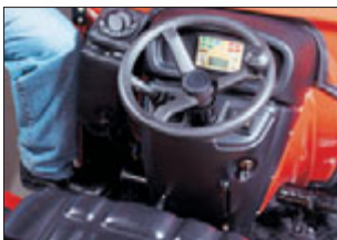
Übersichtlicher, ergonomisch gestalteter Arbeitsplatz. Alle Bedienelemente im direkten Sicht- und Griffbereich.