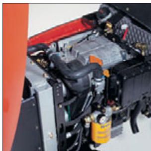
Robuster und leistungsstarker, wassergekühlter Dieselmotor, 12,7 kW (17,3 PS). Ausgezeichnet zugänglich für Wartungs- und Pflegearbeiten.