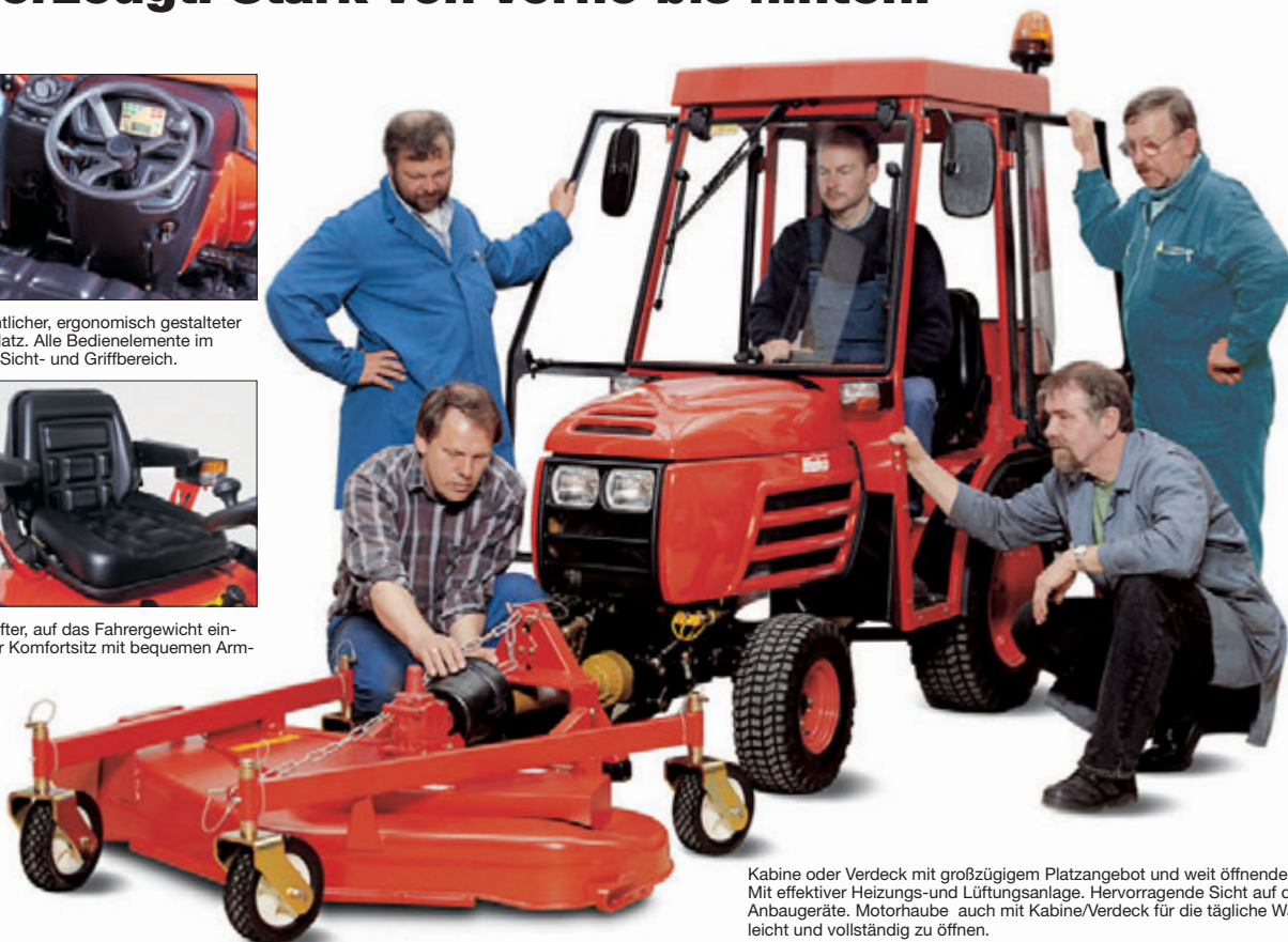
Kabine oder Verdeck mit großzügigem Platzangebot und weit öffnenden Türen. Mit effektiver Heizungs- und Lüftungsanlage. Hervorragende Sicht auf die Anbaugeräte. Motorhaube auch mit Kabine/Verdeck für die tägliche Wartung leicht und vollständig zu öffnen.