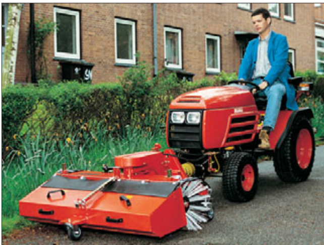
Hakotrac 1700 D Mechanic: Schmutzkehren mit Frontkehrmaschine (Arbeitsbreite 120 cm) und Schmutz-Aufnahmebehälter. Als Option: Spritzschutz, hydraulische Seitenverstellung und Seitenbesen. Zum Freikehren von Schneematsch und Neuschnee läßt sich die Kehrmaschine mit wenigen Handgriffen umrüsten.