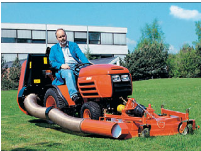
Perfekt ausgerüstet für Mähaufgaben: Hakotrac 1700 DA Hydrostatic mit Front-Rotationsmäher (Arbeitsbreite 125 cm) und Grasabsaugung (Sammelbehälter 450 Liter). Für Wartungs- und Reinigungsarbeiten ist das Mähwerk leicht manuell hochklappbar.